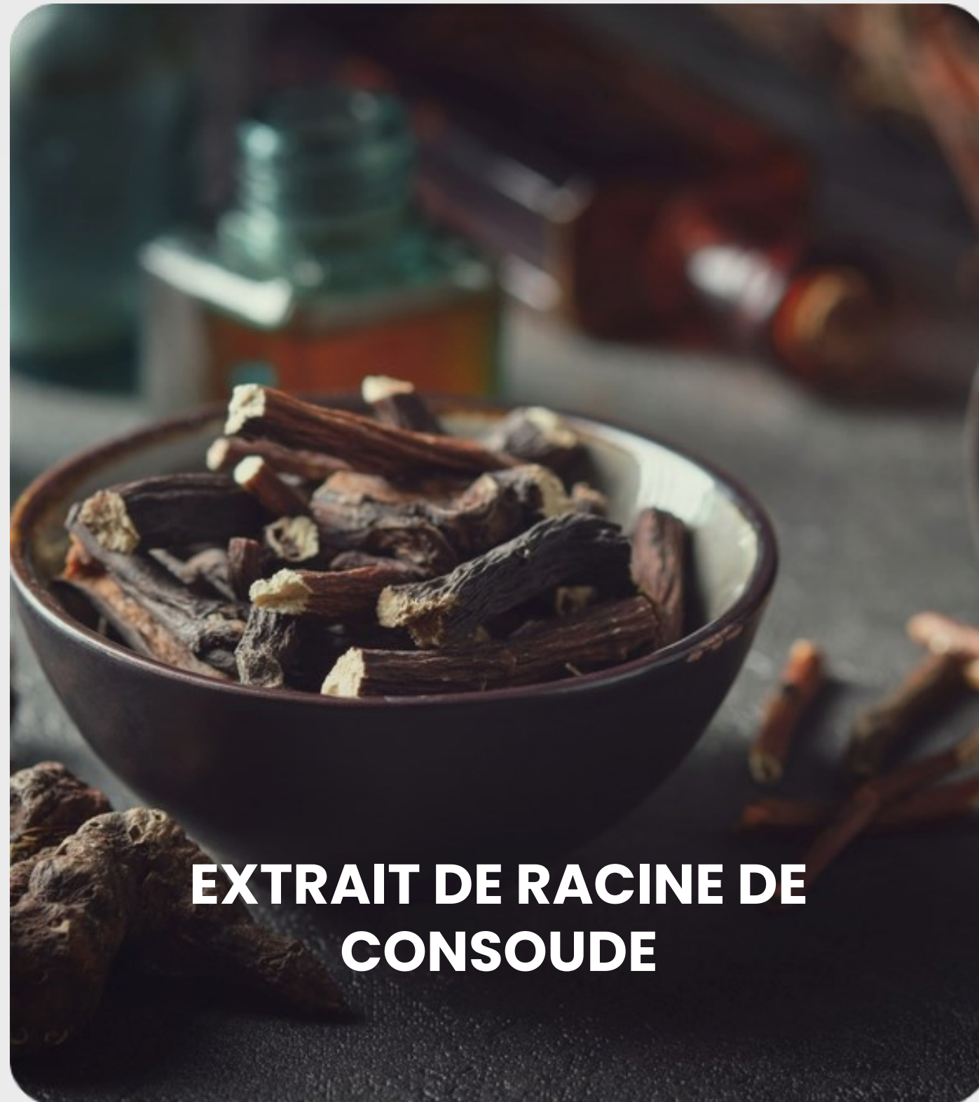
EXTRAIT DE RACINE DE CONSOUDE

Contient de l'allantoïne, du mucus et des tanins. Aide avec des problèmes musculo-squelettiques.