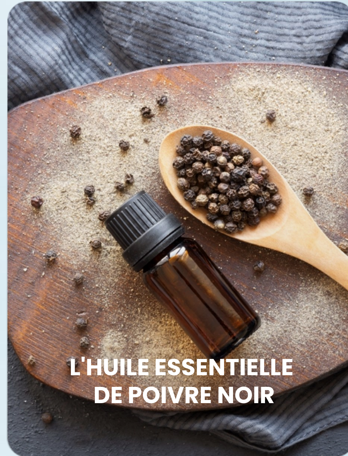
L'HUILE ESSENTIELLE DE POIVRE NOIR

Un effet de drainage lymphatique, réduit l'enflure (lorsqu'il est utilisé avec un massage)