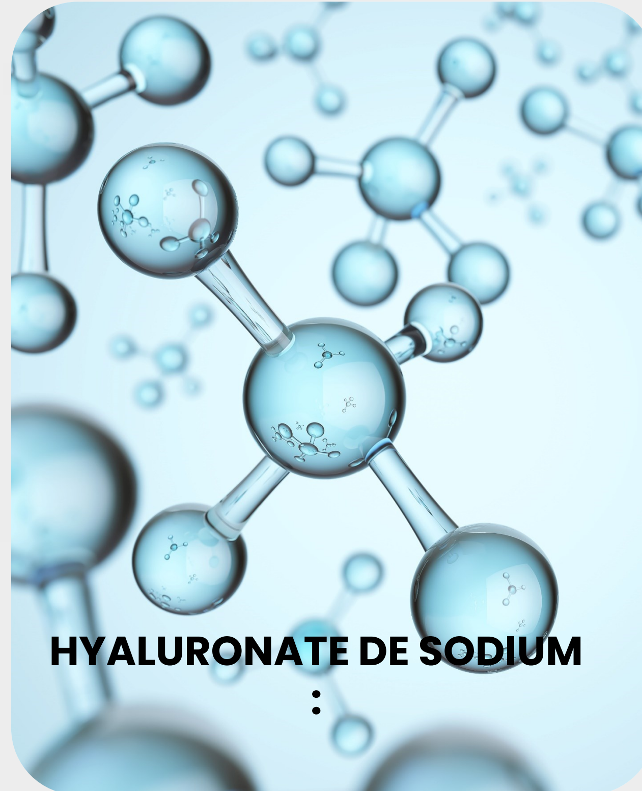
HYALURONATE DE SODIUM

Hydrate, adoucit et apaise intensément la peau, améliorant le teint et l'élasticité. Il a des propriétés cicatrisantes, anti-inflammatoires et antimicrobiennes, réduit les rougeurs et contient des antioxydants qui protègent contre le vieillissement et les rides.