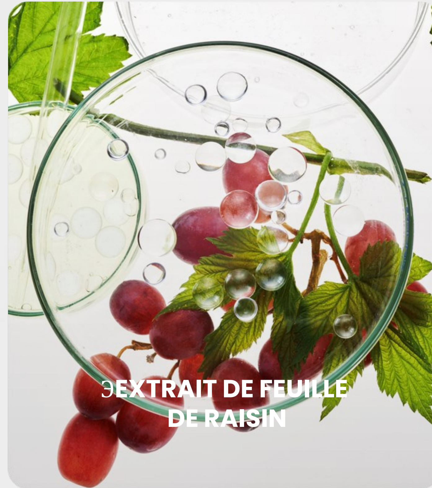
EXTRAIT DE FEUILLE DE RAISIN

Tonifie, a un effet de drainage prononcé, soulage la fatigue « du soir » des jambes.