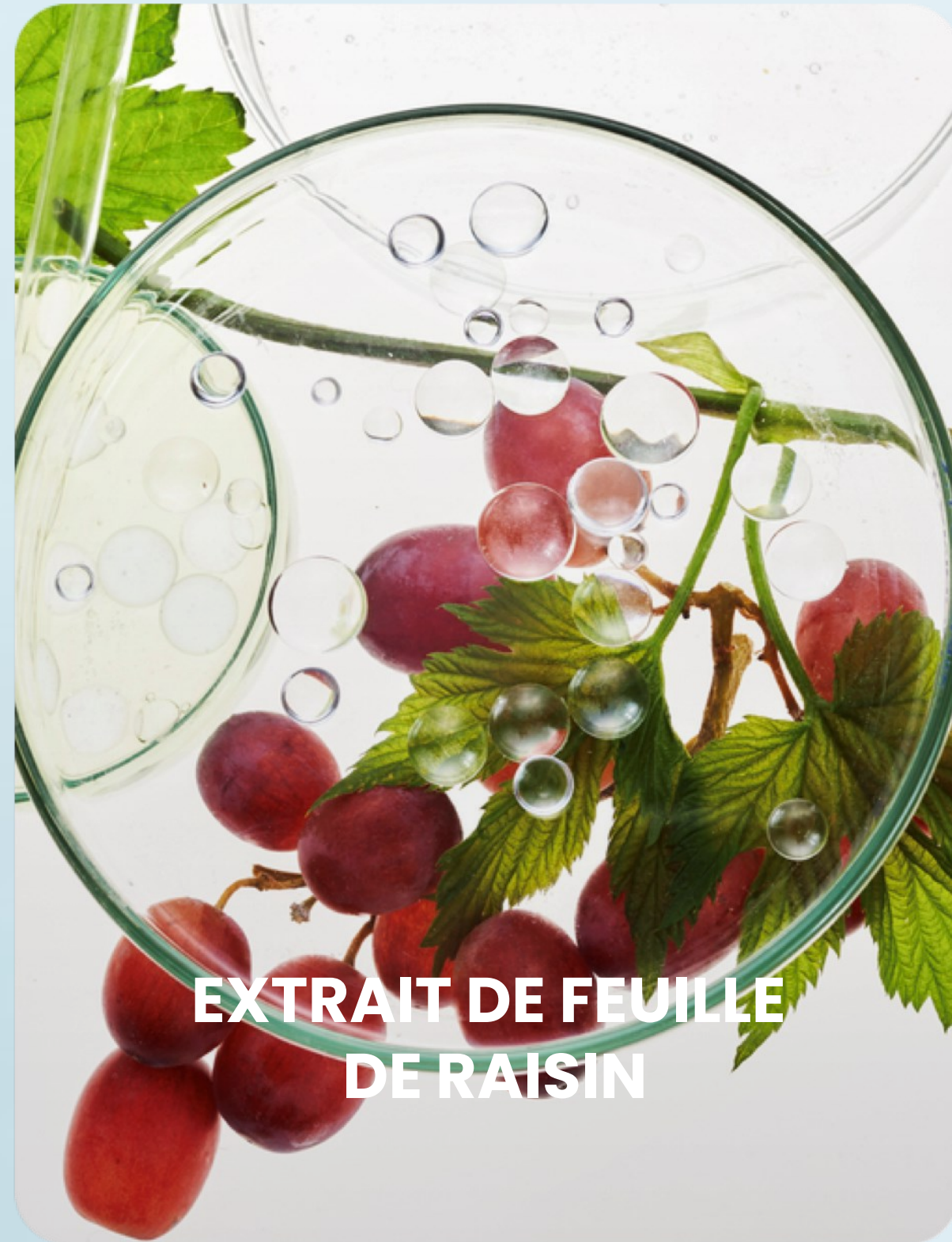
EXTRAIT DE FEUILLE DE RAISIN

Réchauffe la peau, améliore le flux sanguin local