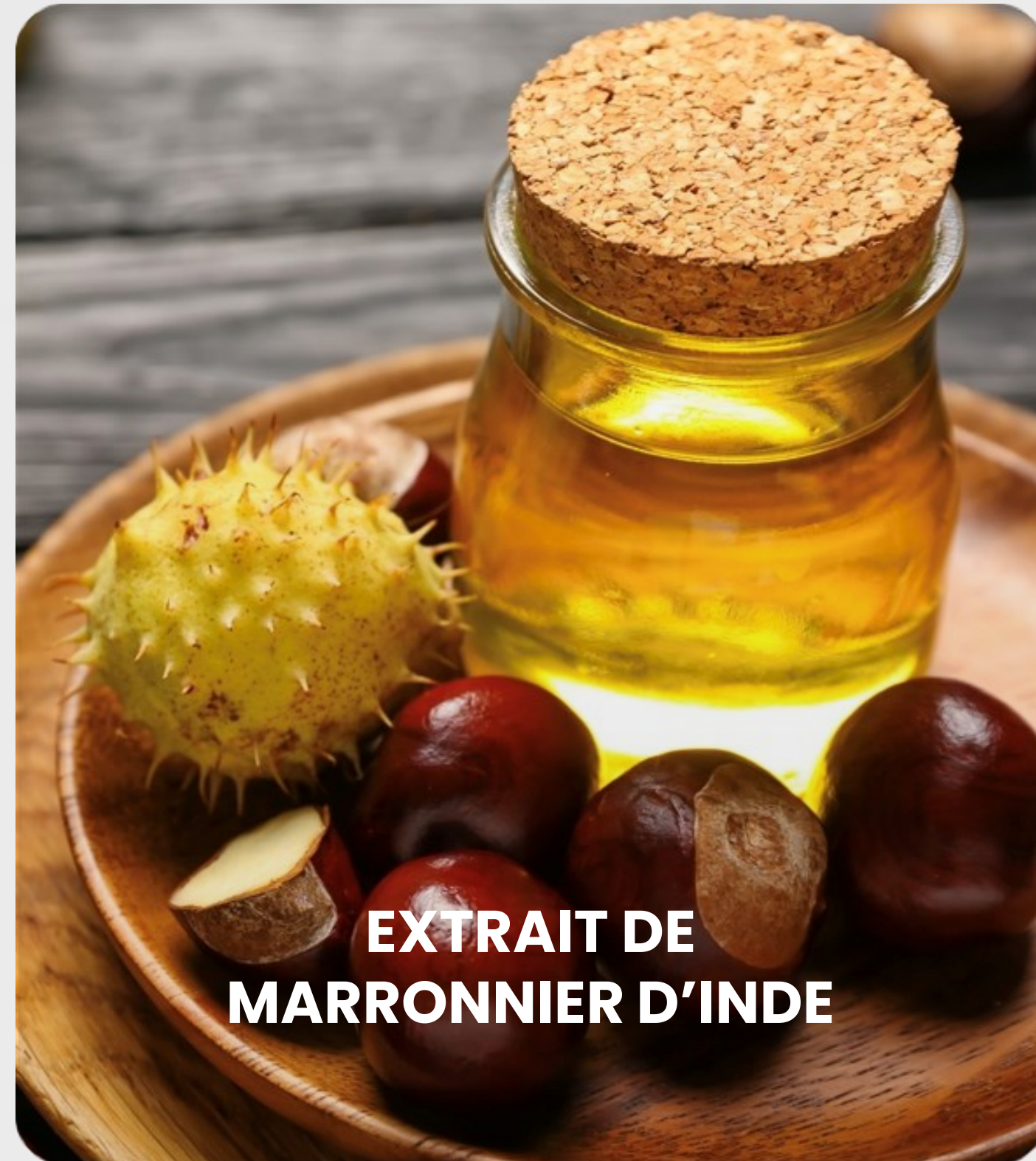
EXTRAIT DE MARRONNIER D'INDE

Tonifie, a un effet de drainage prononcé, soulage la fatigue « du soir » des jambes.