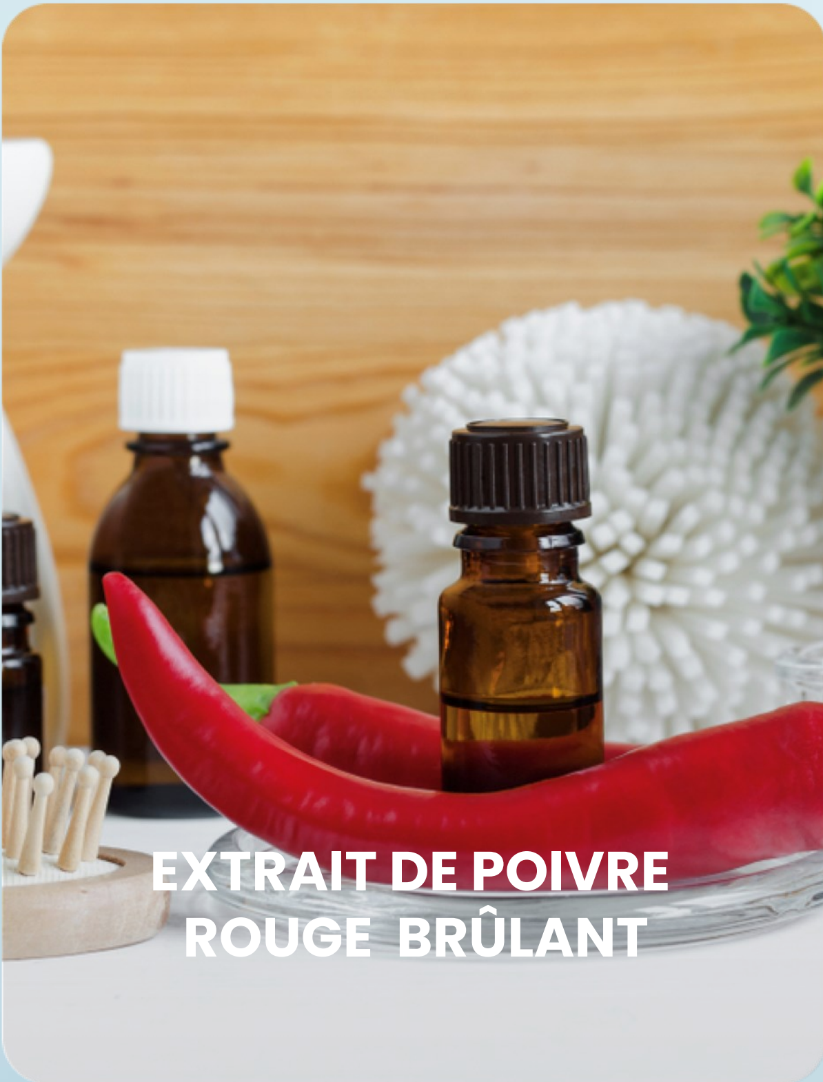
EXTRAIT DE POIVRE ROUGE BRÛLANT

Réchauffe la peau, améliore le flux sanguin local