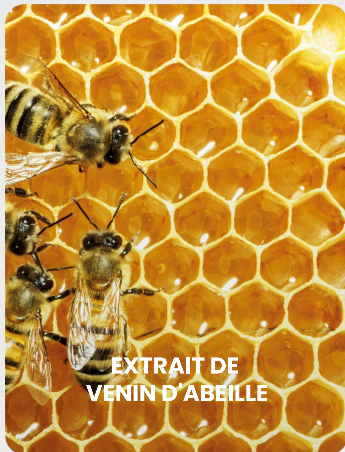
EXTRAIT DE VENIN D'ABEILLE

c'est une source d'acides aminés, de peptides et de protéines qui fournissent un effet anti-inflammatoire, analgésique et biostimulant. Réduit l'inflammation et la douleur dans les articulations et les muscles