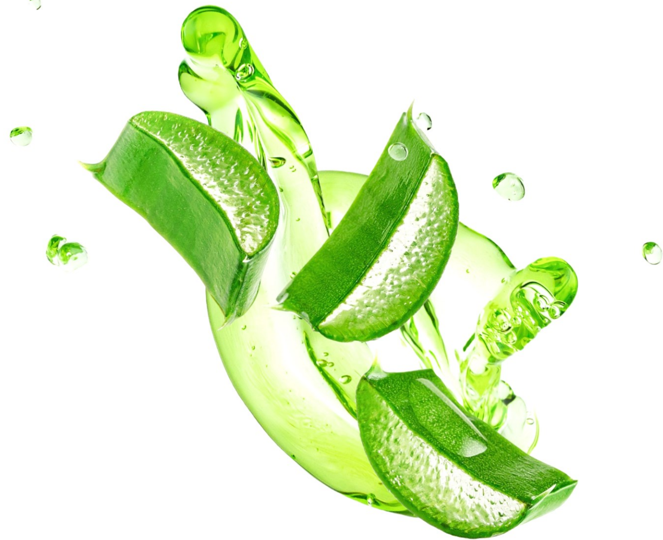
GEL D'ALOE VERA :

Hydrate, adoucit et apaise intensément la peau, améliorant le teint et l'élasticité. Il a des propriétés cicatrisantes, anti-inflammatoires et antimicrobiennes, réduit les rougeurs et contient des antioxydants qui protègent contre le vieillissement et les rides.