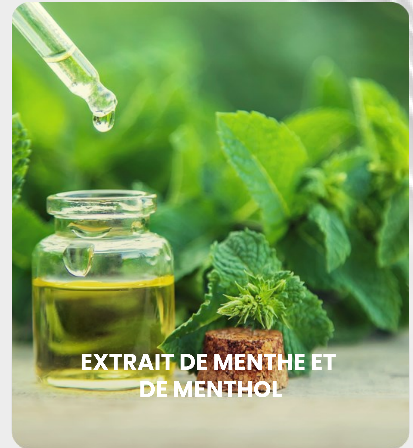
EXTRAIT DE MENTHE ET DE MENTHOL

Source de polyphénols naturels-tonifie, active la régénération.